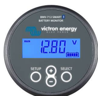
Bluetooth-waarneming: BMV-712 Smart Battery Monitor