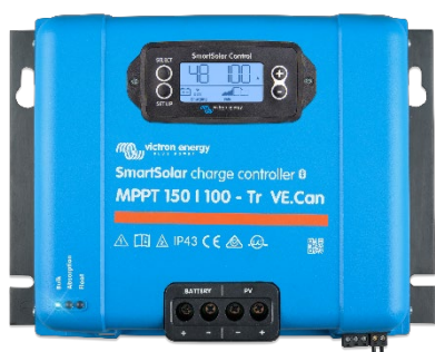
SmartSolar Laadcontroller MPPT 150/100-Tr VE.Can met optioneel insteekbaar beeldscherm