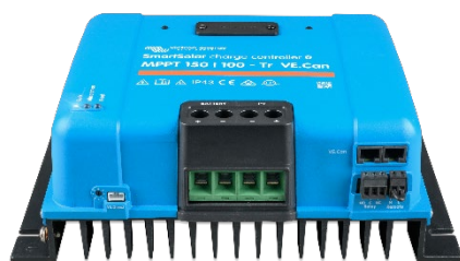
SmartSolar Laadcontroller MPPT 150/100-Tr VE.Can zonder beeldscherm

Verwijder eenvoudig de rubberen afdichting die de plug beschermt aan de voorzijde van de controller en steek het beeldscherm in.