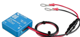
Bluetooth-waarneming: Smart Battery Sense