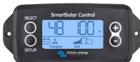
SmartSolar inplugbaar beeldscherm