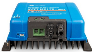
Zonne-laadcontroller MPPT 150/70-MC4