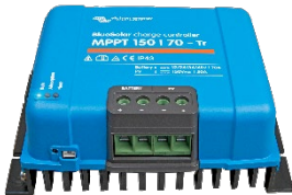
Zonne-laadcontroller MPPT 150/70-Tr