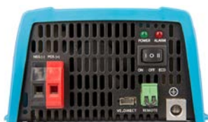
Phoenix 12/375 VE.Direct