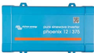
Phoenix 12/375 VE.Direct