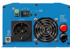
Phoenix omvormer 12/800 met Schuko stopcontact